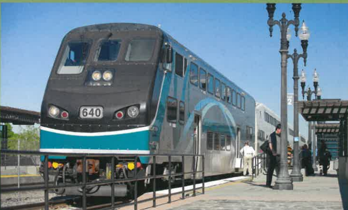
Tren de suburbano – Metrolink