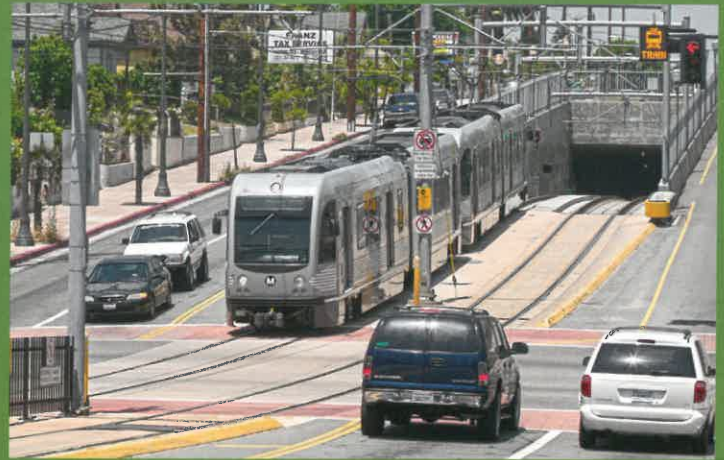
Tren ligero – Metro Gold Line

El servicio de LRT también es diferente del servicio suburbano, que incluye a Metrolink y Amtrak. Aunque ambos tipos normalmente utilizan vías férreas estándar, los trenes suburbanos generalmente tienen trenes más grandes y estaciones regionales espaciadas a varias millas de distancia. Los trenes suburbanos están diseñados para alcanzar velocidades más rápidas y proporcionar servicio entre distancias más largas entre los condados. Otra diferencia operativa implica la frecuencia del servicio. Mientras que el LRT y los trenes suburbanos proporcionan servicio de alta frecuencia durante las horas pico de la mañana y de la tarde, sólo el LRT mantiene intervalos de 15 a 20 minutos durante todo el día.