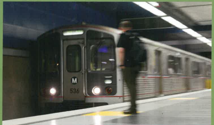
Tren subterráneo – Metro Red Line