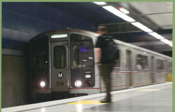
Heavy Rail – Metro Red Line