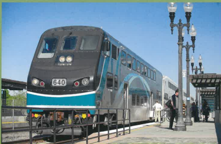
Commuter Rail – Metrolink