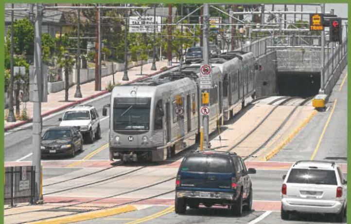
Light Rail – Metro Gold Line

LRT のサービスはMetrolink や Amtrak を含む “commuter rail” と異なります。この両方の交通機関は標準のゲージの線路のレールを使いますが、commuter rail は一般的により大きな電車を含み数マイルごとの間がおかれた複数の地方の駅がかかっています。Commuter rail trainsはカウンティ間をより速いスピードでより長い距離を走る通勤通学のサービスのためにデザインされています。その他の操業上の違いはサービスの頻度を含みます。LRTとcommuter rail の両方が朝と夕方のピーク時には高頻度のサービスを提供しますが LRTだけは全日、15分から 20分間隔を維持しています。